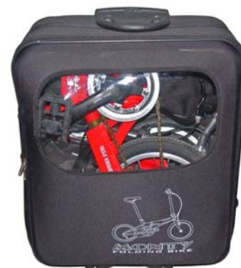
New trolley with window Nueva maleta con ventana